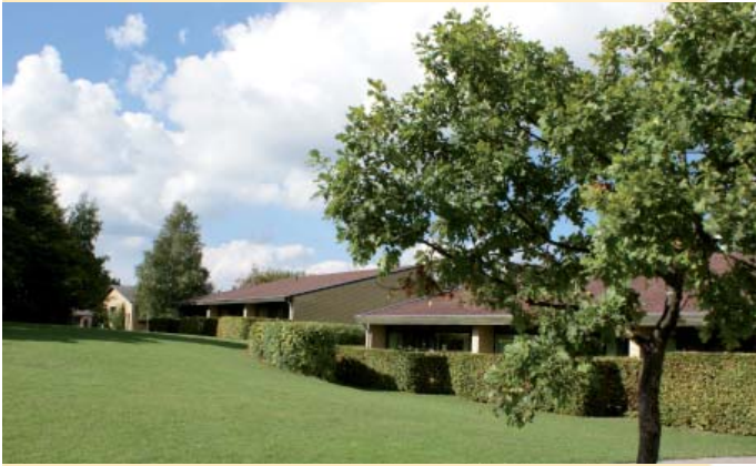
Vigersted skole har undervisning på 0-9 klassetrin.