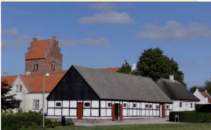
Den fredede Tiendelade med rejseladen i forgrunden. Tiendeladen er bygget i munkesten.