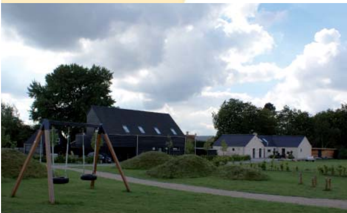
I den nye udstykning ved Humleorevej er fællesarealerne anlagt midt i området.