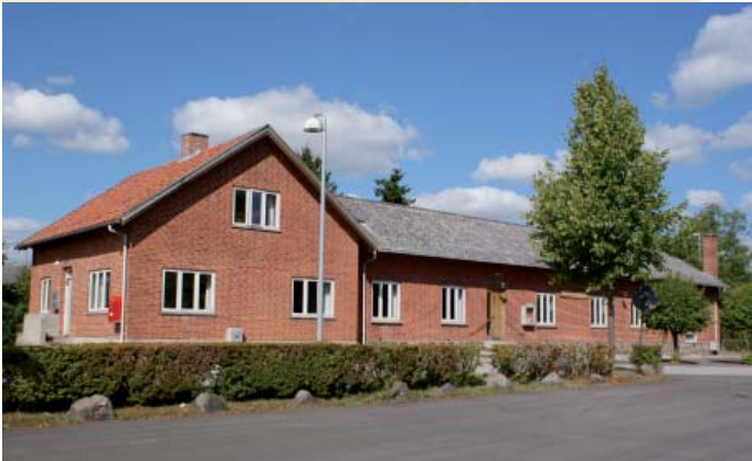
Forsamlingshuset i Vigersted er rammen om fester og kulturelle arrangementer.