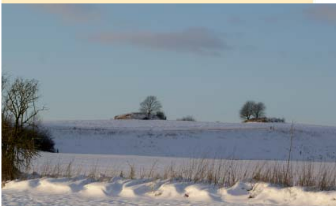
'Tvillingehøjene' fra bronzealderen, som kan ses vest for Vigersted.