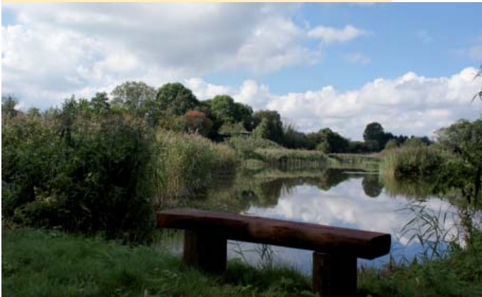
I Kværkeby Fuglereservat kan mere sjældne fugle opleves. Der er også et formidlingshus her.