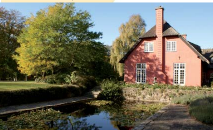
Humleorehus. Haveanlægget er tegnet af C. Th. Sørensen.